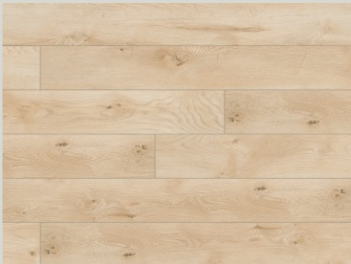
54754 dąb Gordon