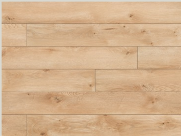
54783 dąb Livingston