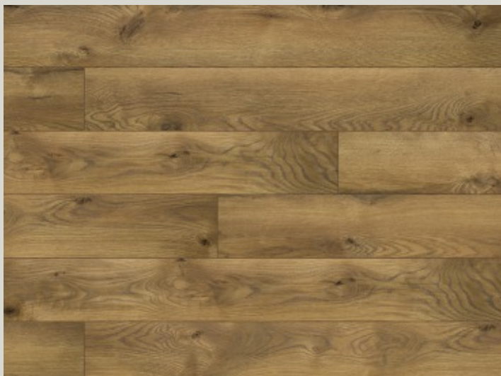
54755 dąb Edynburg