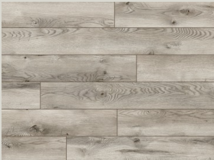
54752 dąb Ashington