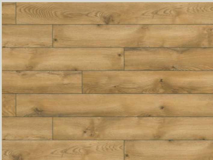
54753 dąb Glasgow