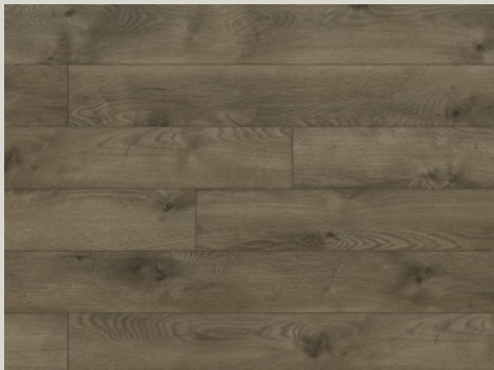
54781 dąb Dandee