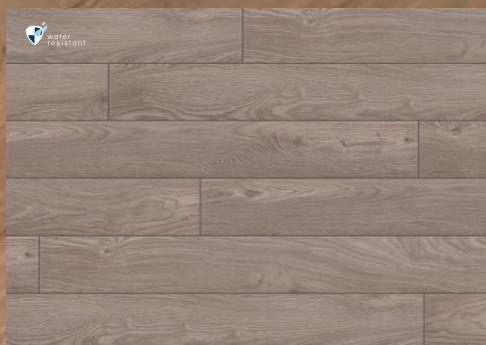
52804 dąb Grenada