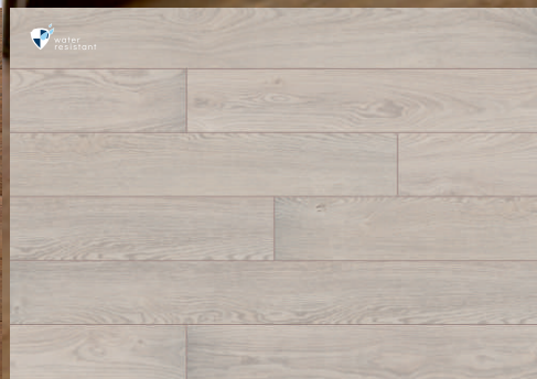
52799 dąb Bassano