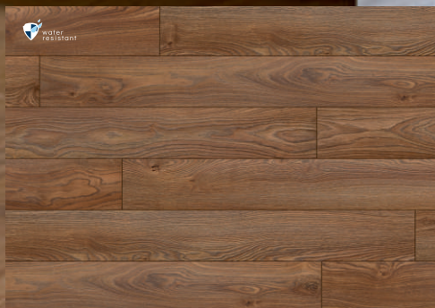
52805 dąb Altea