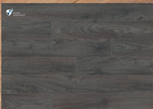
52800 dąb Santana