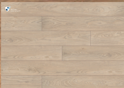
52802 dąb Bilbao