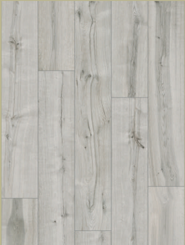
54042 dąb Hoban