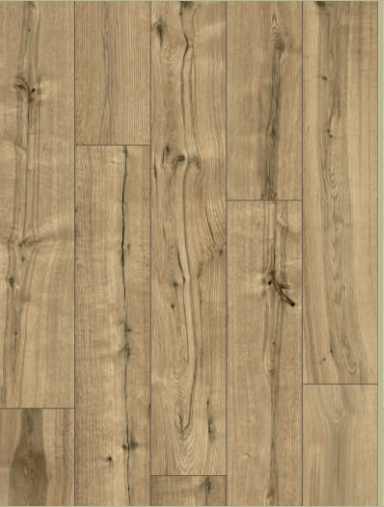
54398 dąb Nantes