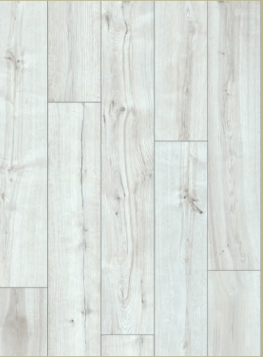
54397 dąb Sartre