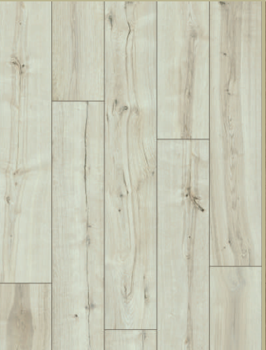
54043 dąb Sacramento