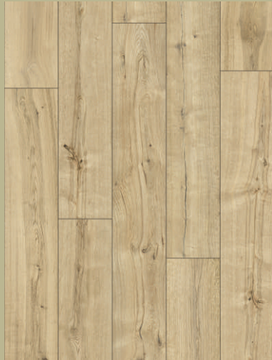
54041 dąb Cabrillo

Podłoga laminowana Classen wyposażona w nowy, zmodyfikowany system montażu Megaloc Aqua Protect oraz rewolucyjną powłokę hydrofobową, która istotnie poprawia odporność krawędzi na pęcznienie. Wylanie, rozlanie, zalanie już nie muszą być problemem, gdyż są one odporne na stojącą wodę przez 24 godziny.