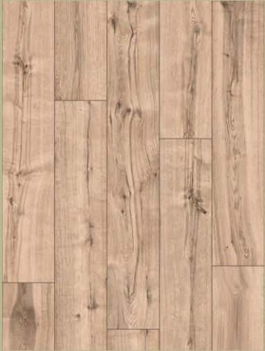
54261 dąb Madison