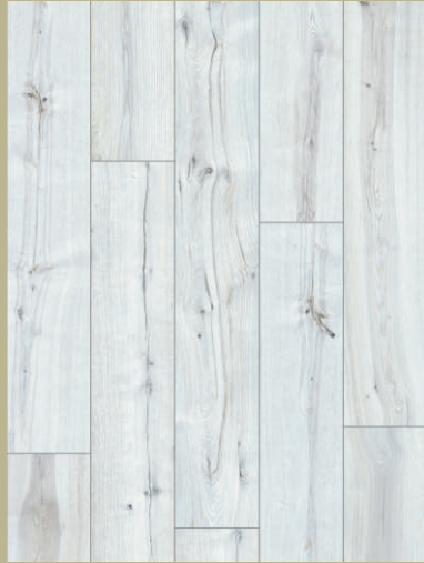
54045 dąb Sherman